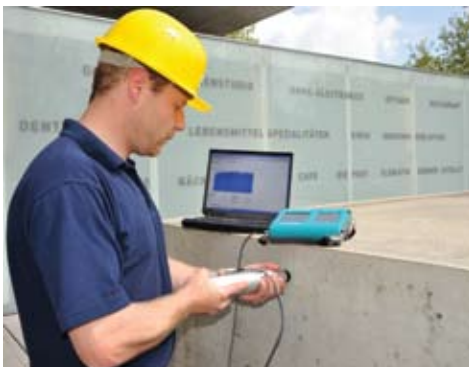
Prüfung und Datenübertragung zu PC/Laptop mit der PC-Software ProVista