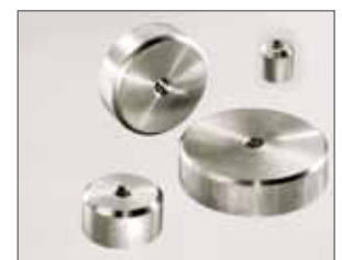
Prüfscheibe \varnothing 50 mm